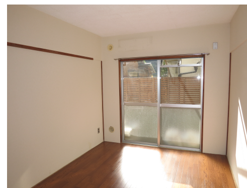
↑ ↓ 改装前の写真 (105号室洋室)